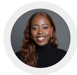
Sherillity van Gobbel